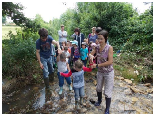
Les enfants les pieds dans l'eau

Une action de sensibilisation a été réalisée auprès de l'école maternelle de Soudan. L'animation a été partagée entre le Syndicat Mixte à la Carte et le CPIE Gâtine Poitevine.