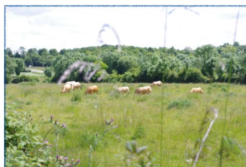
Vaches paissant paisiblement dans une prairie humide...

D'autre part, l'un des principaux leviers d'action pour améliorer l'état de conservation des espèces et habitats du site réside dans l'action auprès des exploitants agricoles du fait de la proportion importante de terrains agricoles dans le bassin versant du Magnerolles.