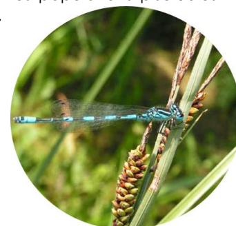
Agrion de Mercure

De nombreuses autres espèces sont étudiées sur le site. Les amphibiens et reptiles (Grenouille rousse, Triton marbré, Alyte accoucheur, Couleuvre verte et jaune) sont suivis de près ainsi que les populations piscicoles (Truites, Chabot, Lamproies).